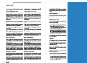
1/2 PÁGINA ALTO 100x297 mm