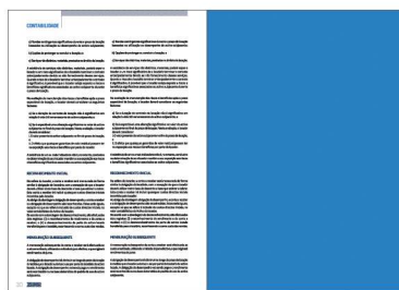
PÁGINA IMPAR 210x297 mm