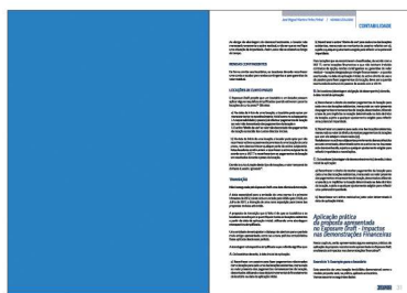
PÁGINA PAR 210x297 mm