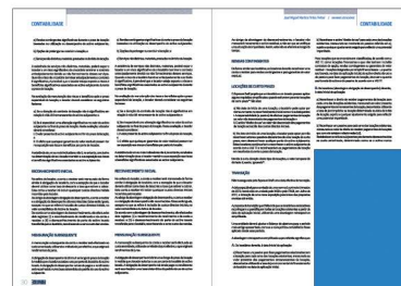
1/4 PÁGINA 100x148,5 mm